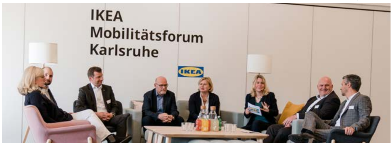
IKEA Mobilitätsforum 2019, Karlsruhe