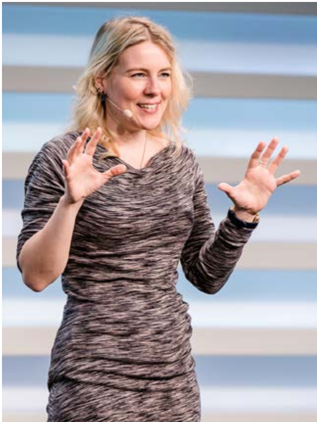
Nachhaltig.digital Konferenz 2018, Bonn