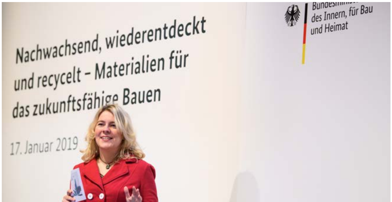
Nachhaltig Bauen / Expo Real 2019, München