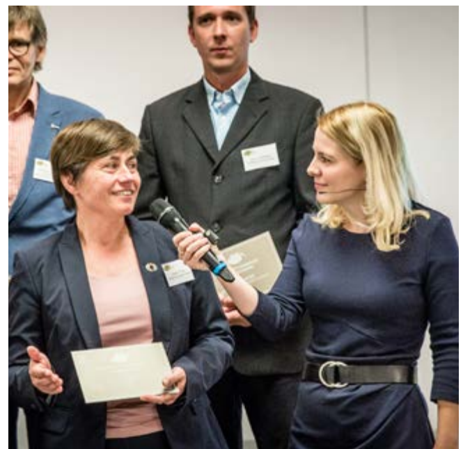
Ökoprofit Jubiläum 2019, Hannover